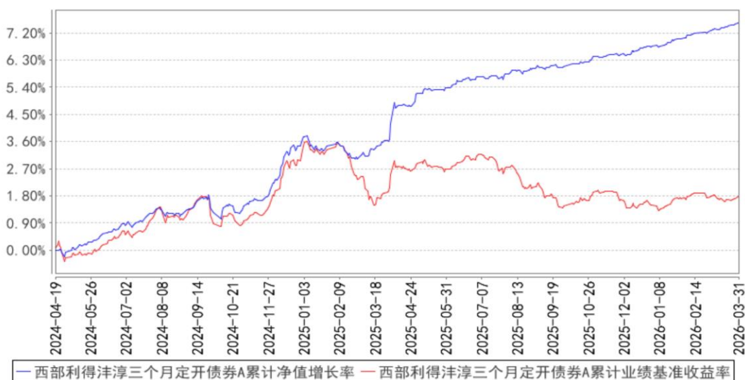
西部利得沔淳三个月定期开债券A累计净值增长率与同期业绩比较基准收益率的历史走势对比图

2) 西部利得沔淳三个月定期开放债券型证券投资基金 C（2024 年 04 月 19 日至 2026 年 03 月 31 日）