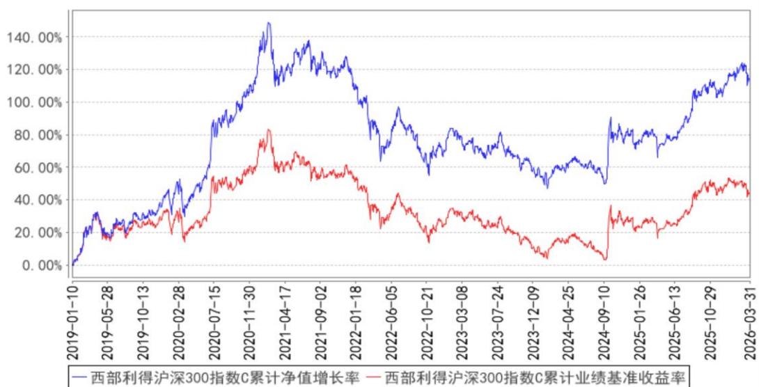
西部利得沪深300指数C累计净值增长率与同期业绩比较基准收益率的历史走势对比图