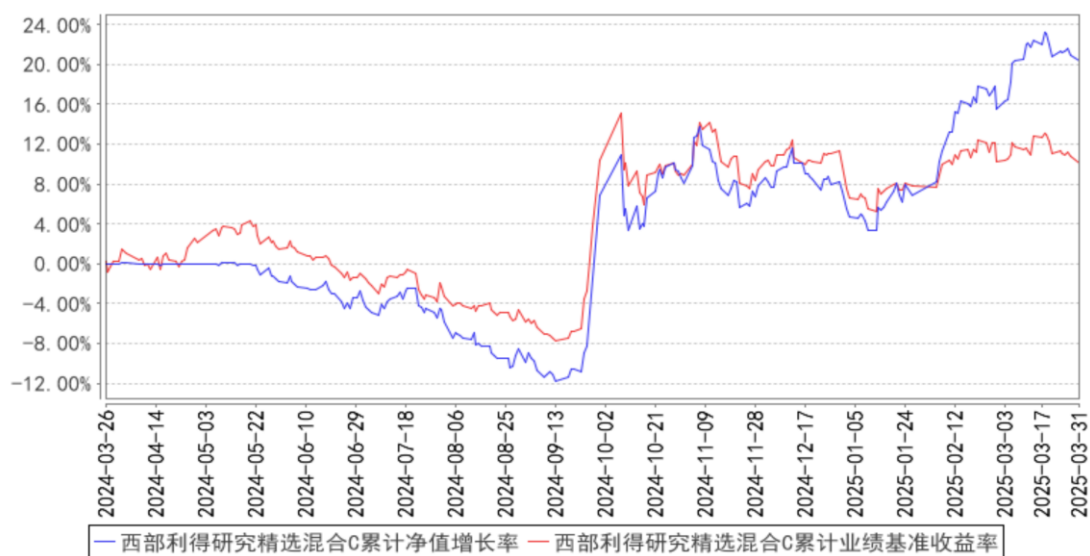
西部利得研究精选混合C累计净值增长率与同期业绩比较基准收益率的历史走势对比图