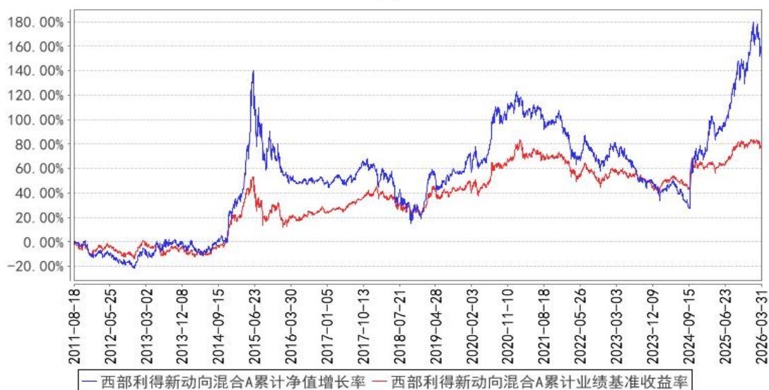
西部利得新动向混合A累计净值增长率与同期业绩比较基准收益率的历史走势对比图