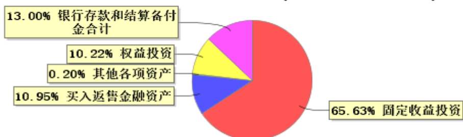
投资组合资产配置图表(2022年6月30日)

● 固定收益投资 ● 买入返售金融资产 ● 其他各项资产 ● 权益投资 ● 银行存款和结算备付金合计