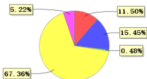
投资组合资产配置图表(2021年6月30日)

● 固定收益投资 ● 买入返售金融资产 ● 其他各项资产 ● 权益投资 ● 银行存款和结算备付金合计