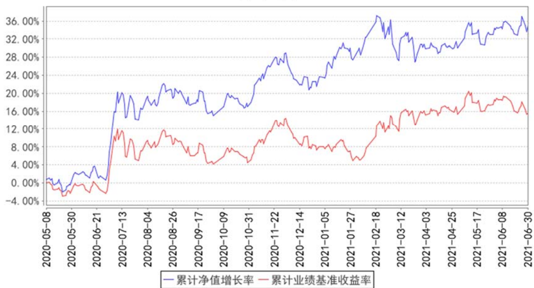
西部利得国企红利指数增强C累计净值增长率与同期业绩比较基准收益率的历史走势对比图