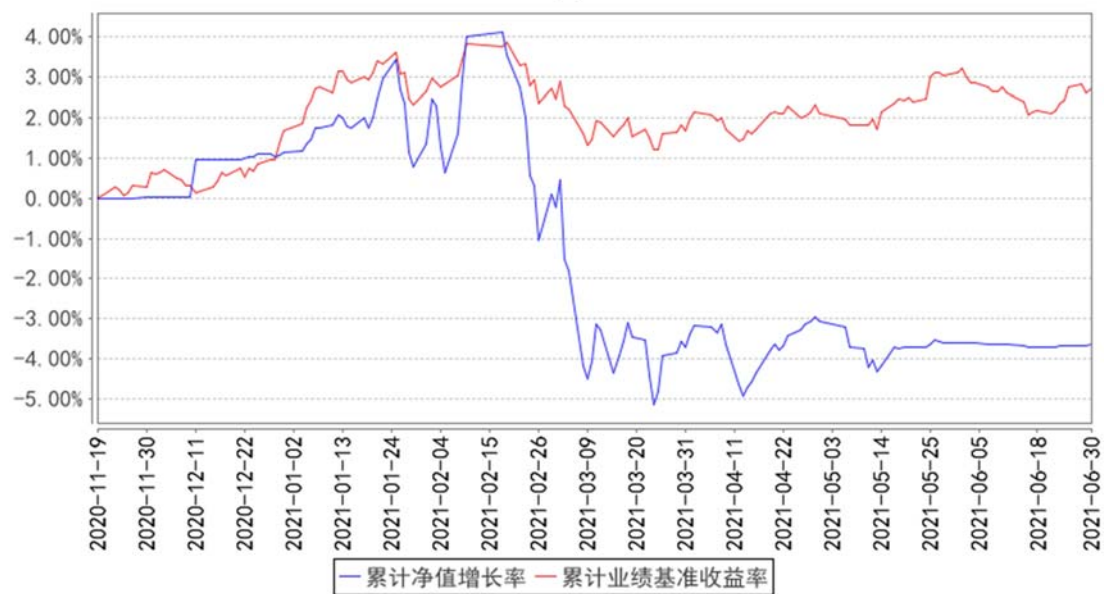
西部利得鑫泓增强债券C累计净值增长率与同期业绩比较基准收益率的历史走势对比图