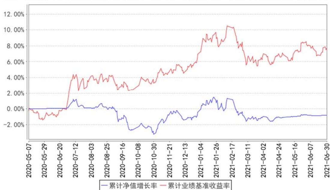
西部利得新享混合A累计净值增长率与同期业绩比较基准收益率的历史走势对比图