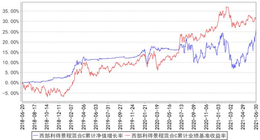
西部利得景程混合C累计净值增长率与同期业绩比较基准收益率的历史走势对比图