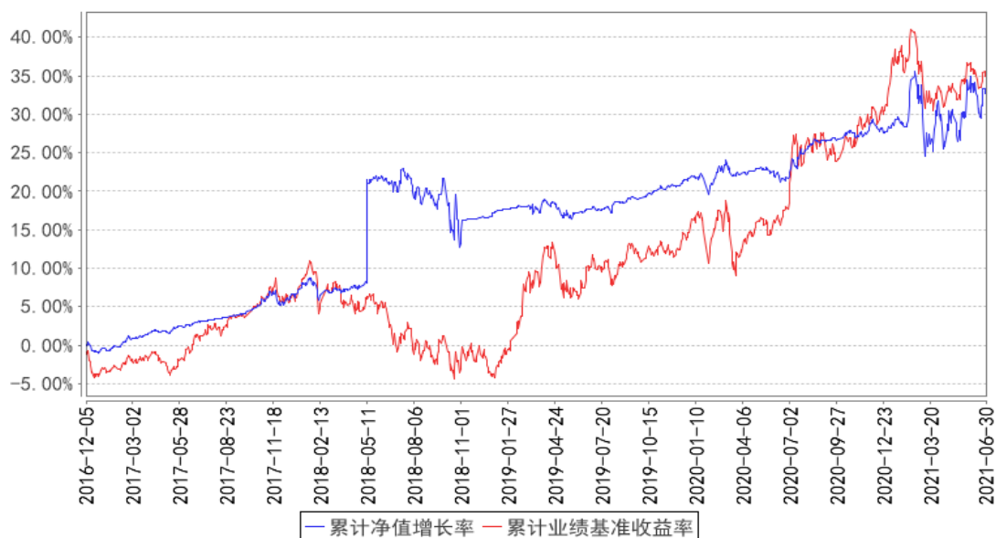
西部利得祥运混合A累计净值增长率与同期业绩比较基准收益率的历史走势对比图