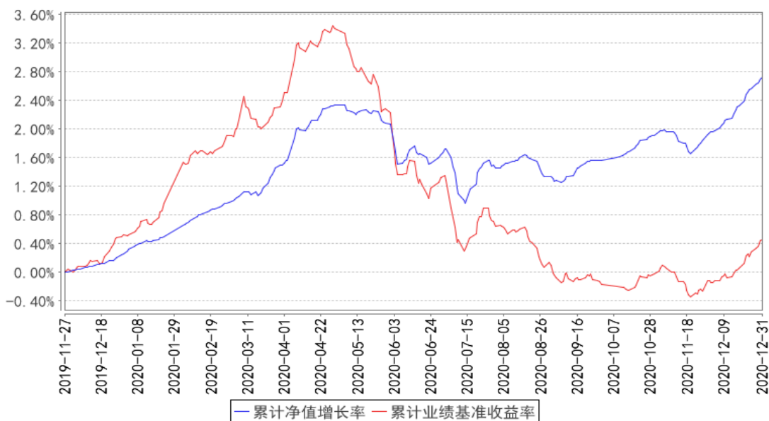
西部利得沔泰债券累计净值增长率与同期业绩比较基准收益率的历史走势对比图